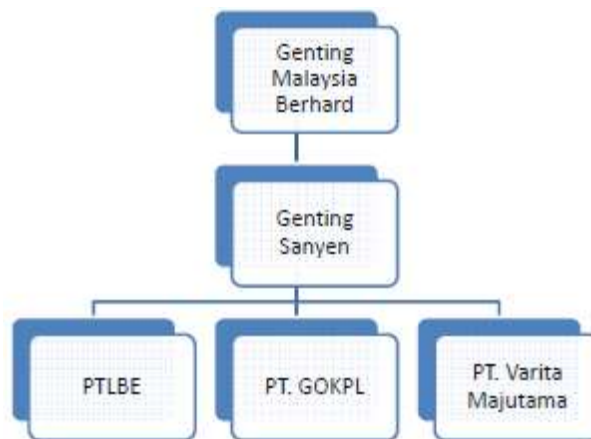
Gambar 2.1 Struktur Perusahaan

Genting Group didirikan oleh almarhum Tan Sri (Dr) Lim Goh Tong pada tahun 1965. Genting Berhad adalah pemegang investasi dan merupakan manajemen perusahaan dari Genting Group. Perusahaan ini didirikan berdasarkan Companies Act 1965 pada tanggal 30 Juli 1968 berdasarkan nama asli Genting Highlands Hotel Sdn Bhd untuk mengoperasikan sebuah hotel dan kasino, dan untuk mengembangkan kompleks wisata terpadu di Genting Highlands, Malaysia. Perusahaan ini berganti nama menjadi Genting Highlands Hotel Berhad setelah konversi menjadi perusahaan publik pada tanggal 24 Juli 1970. Pada tanggal 9 Juni 1978 namanya diasumsikan sekarang menjadi Genting Berhad.