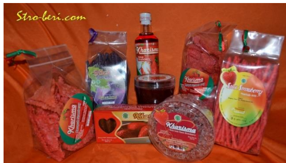
Gambar I.2 Produk Kharisma

Kharisma sudah memiliki logo sebagai identitas dari usahanya, namun identitas tersebut dirancang tidak konsisten, sehingga dapat mempengaruhi citra merek dan kehilangan fungsinya sebagai identitas untuk membedakan merek Kharisma dengan merek yang lain. Logo Kharisma menggunakan jenis huruf yang telah disediakan software tanpa menambahkan visualisasi yang dapat menjadi ciri khas, sehingga logo Kharisma mudah ditiru dan rentan dengan kemiripan. Berdasarkan wawancara bersama owner logo ini dibuat oleh sendiri namun dikarenakan owner kurang memahami desain sehingga logo dibuat berdasarkan visual estetika saja tanpa memiliki kandungan arti atau nilai filosofis dari citra merek.