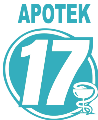
Gambar 2.1. Logo Apotek 17

Logo Perusahaan merupakan identitas yang bisa menjadi ciri dan menunjukkan jati diri dari perusahaan tersebut. Logo dari apotek 17 dapat dilihat pada Gambar 2.1.