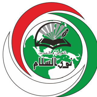
Gambar II. 3. Logo kedua Yayasan Nurussalam 2012–2022.

Logo pertama Pondok Pesantren Modern Nurussalam periode tahun 1998 sampai dengan 2012. Logo tersebut dibuat oleh salah satu alumni, dalam logo tersebut tergambaran sebuah tulisan Arab 'Kulliyatu-l-Mu'allimin Al-Islamiyyah' dengan kombinasi objek seperti; dua buah sayap, bentuk outline dari buku terbuka yang menggambarkan bola dunia dan Ka'bah pada bagian dalamnya dan diakhiri dengan tulisan Arab 'Nurussalam' juga bulan pada bagian bawahnya.