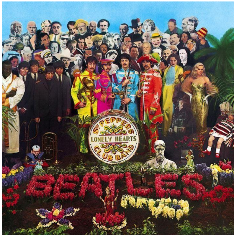
Gambar I.4 Foto Cover Album Sgt. Pepper's Lonely Hearts Club Band