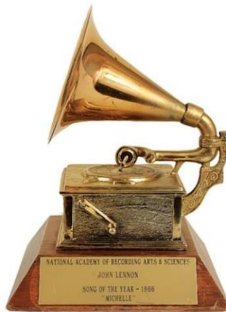
Gambar I.3 Foto Salah Satu Piala Grammy Awards The Beatles Dari Lagu Michelle Sumber: https://www.nydailynews.com/new-york/recording-academy-suesmidtown-shop-john-lennon-grammy-article-1.2585441 (Diakses pada 02/02/2022)