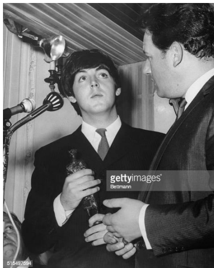
Gambar I.1 Foto Paul McCartney dari The Beatles Saat Menerima Penghargaan

Informasi mengenai album ini terbatas pada penelitian dan artikel di media massa. Artinya, sebagai objek sangat terbuka peluang untuk dikemas menjadi media yang berbeda. Dengan demikian dibutuhkan berupa media yang lebih menarik dan mudah dipahami, sehingga perlu adanya perancangan mengenai album mulai dari pengenalan album secara umum, cerita sejarah dibalik cover , makna lagu-lagu dan juga biografi singkat tentang siapa saja tokoh-tokoh yang dipakai The Beatles pada sampul album bagian depan, dengan dilengkapi visualisasi. Nantinya media tersebut bisa dijadikan sebagai collectible item khususnya bagi penggemar The Beatles dan manfaat lain untuk masyarakat bisa mendapatkan pengetahuan tentang musik dari album Sgt. Pepper dan desain sebagai media komunikasi juga bagi para desainer menambah referensi visual dalam tema psikedelik.