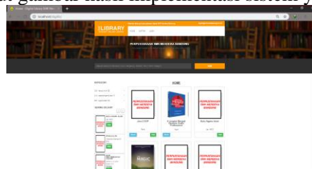
Gambar 13. Tampilan Halaman Utama Pengunjung

Implementasi yang penulis lakukan adalah Implementasi Perangkat lunak, Implementasi Perangkat Keras, Implementasi Basis Data (Sintaks SQL), Implementasi Antar Muka. Dan berikut gambar hasil implementasi sistem yang penulis usulkan