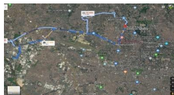
Gambar II.2 Lokasi Perusahaan dari Dipatiukur