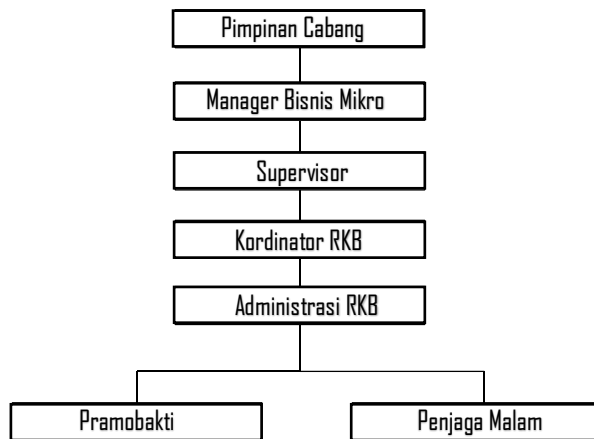
Tabel II.1 Struktur Organisasi Perusahaan Rumah Kreatif Bandung

Pembimbing : posisinya berada sejajar dengan beberapa posisi lain dan bertugas mengoordinasikan operasional atau kegiatan kelompok tersebut. Administrasi : Dina Oktriani. Kemudian diikuti oleh 2 orang Pegawai, usaha atau kegiatan yang berkenaan dengan penyelenggaraan kebijaksanaan untuk mencapai tujuan.