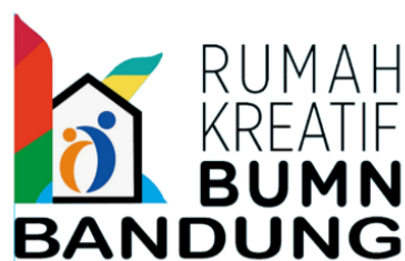
Gambar II.1 Logo Perusahaan RKB