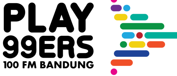
Gambar II.3 Logo PLAY99ERS