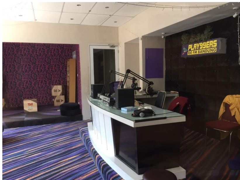
Gambar II.2 Foto Ruang Siaran

Ninetyiners terletak di Jalan Ir. H Juanda No.126B Bandung Lebak Gede, Coblong, Kota Bandung, Jawa Barat 40132, tepat di sebrang Pom Bensin Dago. Jam Kerja dimulai dari 09.00 – 17.00 WIB.