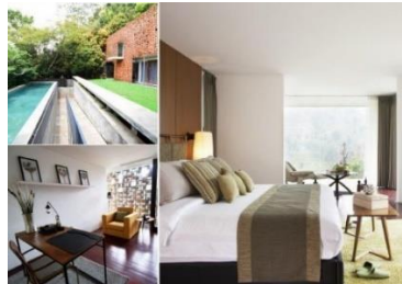
Gambar II.2 Alinda Townhouse

Alinda adalah jenis hunian yang elegan dan nyaman, kokoh berdiri di lahan miring terutama di lahan perbukitan Dago Giri. Alinda dibangun dengan konsep yang dirancang oleh Hadi Vincent, desain yang minimalis namun tetap mempertahankan kesan mewah dan dekat dengan alam. Alinda memiliki atap yang didesain khusus sebagai tempat bersantai, lengkap dengan konsep taman kecil sehingga cocok untuk menikmati pemandangan kawasan Dago Giri.