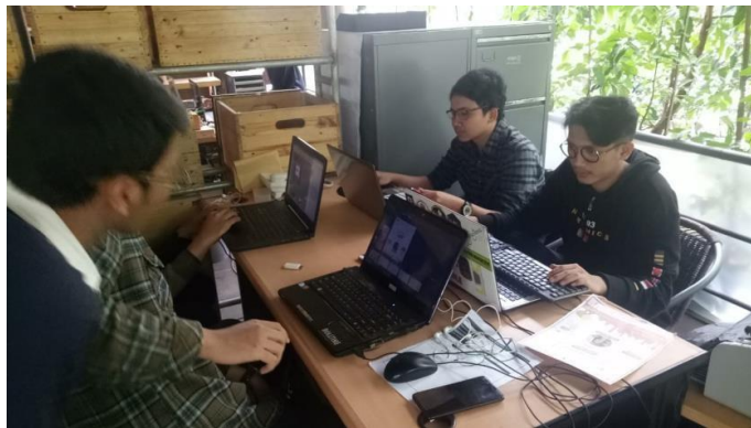
Gambar II.10 Foto Bagian Dalam Kantor PT. Pramesta Mountain City