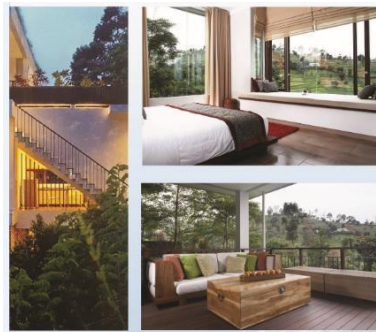
Gambar II.5 Avika Villa

Avika berarti sesuatu yang berharga dan berasal dari alam. Arsitek Yori Antar, menuangkan inspirasi dan keinginannya pada pembangunan Avika, sehingga terciptalah hunian yang modern dan ramah lingkungan. Avika memiliki desain yang menggunakan konsep art deco yang identik dengan kota Bandung.