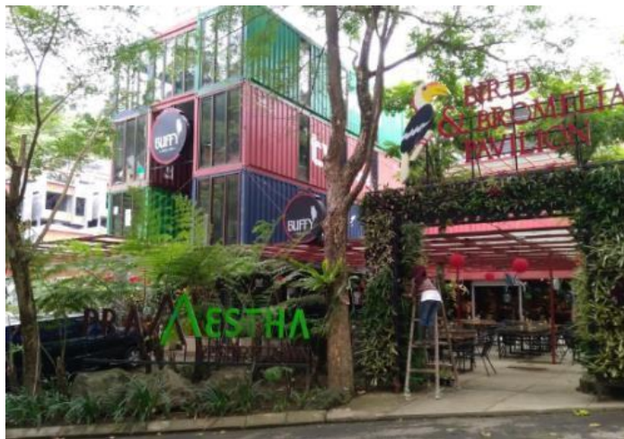
Gambar II.8 Foto Suasana Luar PT. Pramestha Mountain City