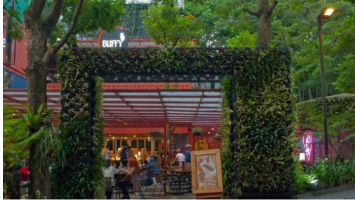
Gambar II.9 Foto Bagian Luar Kantor PT. Pramesta Mountain City