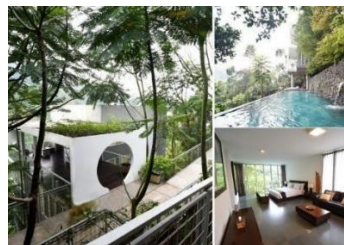
Gambar II.3 Amala Villa

Amala berasal dari bahasa sansakerta yang berarti bersih, cerah dan tidak terhalang. Tan Tik Lam merancang Amala dengan dengan teknik downslope , teknik ini memiliki 4 tingkat konstruksi yang dibangun diatas pondasi bored/pile sehingga dapat memberi banyak ruang untuk serapan air di tanah. Ini digunakan untuk mengurangi penggunaan teknik pondasi cut-fill yang mana teknik konstruksi ini akan mengurangi ruang serapan air.