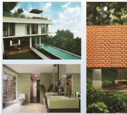
Gambar II.4 Alea Villa

Alea berasal dari bahasa sansakerta yang berarti asal, tertinggi, dan memuliakan. Andra Martin merancang Alea dengan konsep yang unik sehingga terciptanya konsep hunian yang nyaman dan tenang ditengah alam perbukitan Dago Giri. Interior dan eksterior alea dirancang menggunakan material dari alam seperti batu kali, tanah liat, dan kayu. Alea dirancang dengan sistem ventilasi khusus sehingga dapat merasakan nuansa rumah yang tenang, dan terasa menyatu dengan alam.