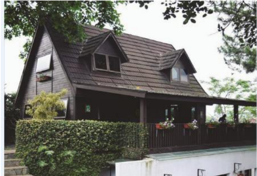
Gambar II.6 Wood Villa

Wood Villa merupakan hunian yang terletak dibagian atas bukit Dago Giri, sehingga cocok untuk bersantai menjauh dari kesibukan kota, menghilangkan stress dari pekerjaan. Wood Villa cocok untuk menikmati suasana tenang ditengah alam Dago Giri, menyaksikan matahari terbenam serta berubahnya langit dari warna kuning keemasan hingga menjadi hitam penuh dengan bintang. Wood Villa dibangun dengan konstruksi kayu yang kokoh. Dilengkapi dengan eksterior balkon kayu yang cocok untuk dijadikan tempat bersantai yang nyaman, menikmati angin berhembus ditengah alam, menyatu dengan alam lembah bukit Dago Giri.