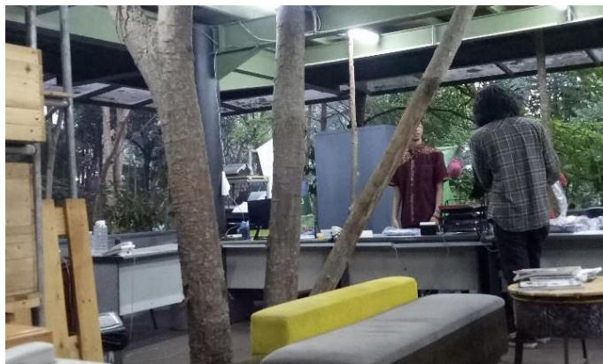
Gambar II.11 Foto Bagian Dalam Kantor PT. Pramesta Mountain City