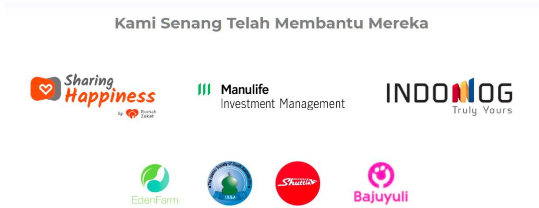
Gambar II.6 Mitra Perusahaan yang telah mempercayai Chatbiz

berkerjasama dengan Chatbiz.id diantaranya Sharing Happines, Manulife Investment Management, Indomog, Eden Farm, I.S.S.A, Bhinneka shuttle, dan Bajuyuli.