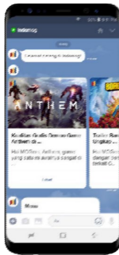
Gambar II.1 Indomog menggunakan asisten virtual Chatbiz.id

Pada tahun 2018 menjadi awal sebelum Chatbiz dibentuk. Periode ini para pendiri perusahaan melakukan penggodokan inovasi tentang teknologi kecerdasan buatan secara intensif yang terus dilakukan, seiring dengan pengembangan aplikasi digital oleh tim teknologi yang terus berlangsung. Pembuktian atau uji coba terhadap kualitas asisten virtual juga dilakukan.