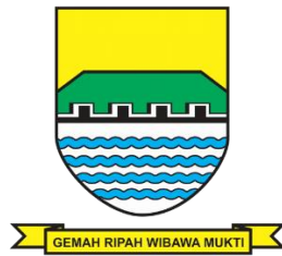
Gambar II.1 Logo DP3APM