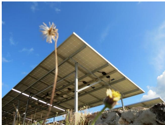
Gambar II.1 Panel Solar

Nama : Bambang Iswanto Jabatan : Direktur Utama Telepon : 022 7351 8273