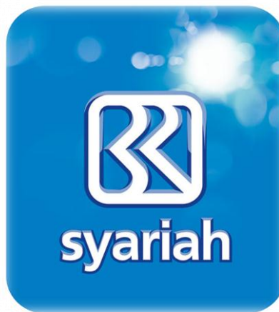
Gambar 2.1 Lambang PT. Bank Rakyat Indonesia Syariah

Lambang Perusahaan Setiap perusahaan senantiasa dilengkapi dengan lambang perusahaan. Lambang mempunyai arti penting karena lambang merupakan identitas bagi setiap perusahaan. Lambang perusahaan PT. Bank Rakyat Indonesia Syariah dapat dilihat sebagai berikut :