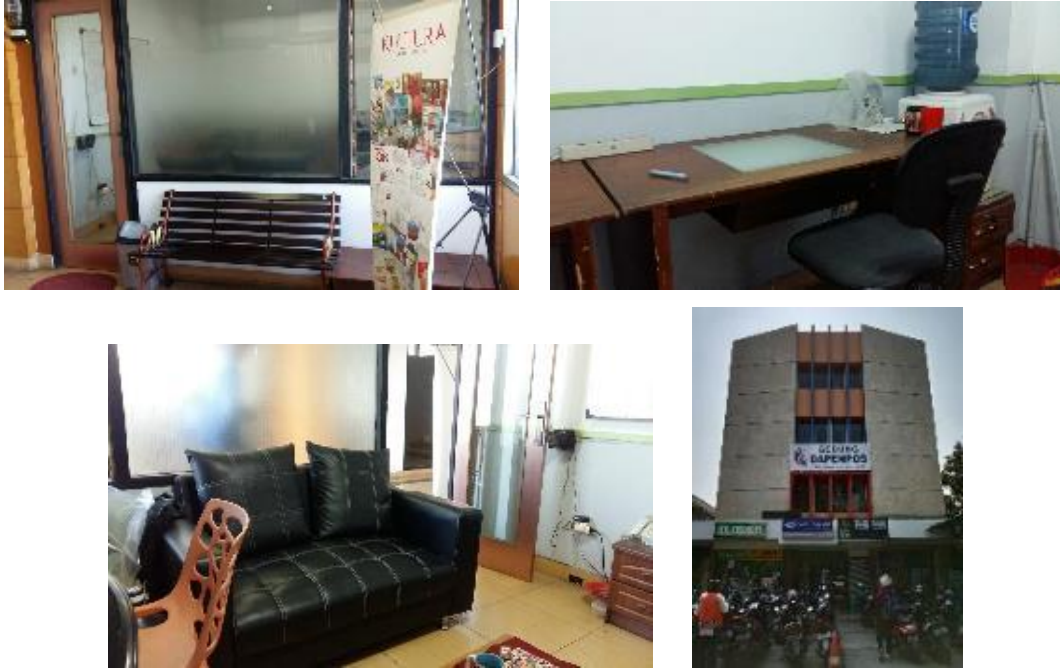
Gambar II.3 Kantor PT Kultura yang berada di Gedung DAPENPOS