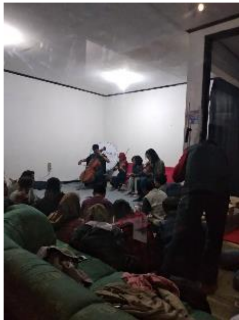
Gambar II.6 Ruang utama di Komuji

Gambar diatas adalah ruangan cafe PT. Kultura yang berada di kantor kedua dari PT. Kultura yang memiliki fasilitas cafe. Cafe ini tidak hanya digunakan untuk karyawan tetapi terbuka untuk umum.