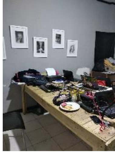
Gambar II.4 Basecamp PT Kultura yang berada di Rumah Komuji