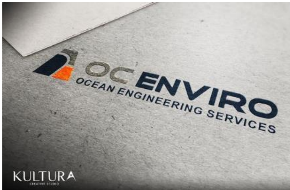
Gambar II,12 OC Enviro Branding Project