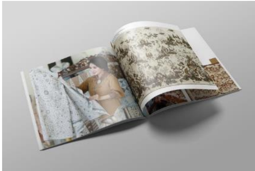
Gambar II.7 Batik Pantura Book Layout Design Project

Gambar berikut adalah Portofolio kedua merupakan komik hasil karya PT.Kultura