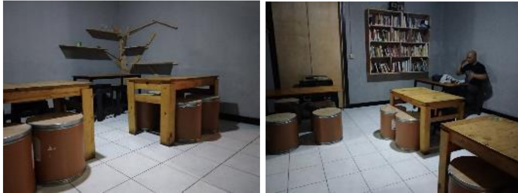
Gambar II.5 Cafe yang berada di Komuji

Gambar diatas adalah ruangan cafe PT. Kultura yang berada di kantor kedua dari PT. Kultura yang memiliki fasilitas cafe. Cafe ini tidak hanya digunakan untuk karyawan tetapi terbuka untuk umum.