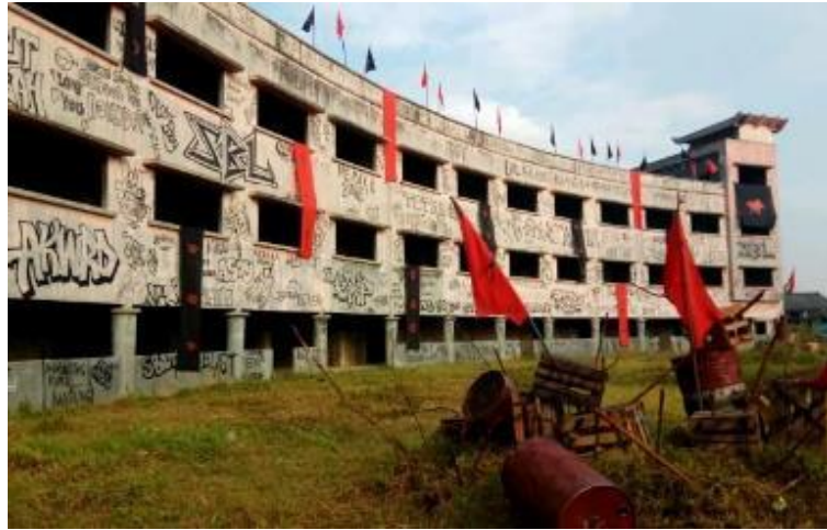
Gambar II.9 Project Art Department of Total Chaos (2017) Movie