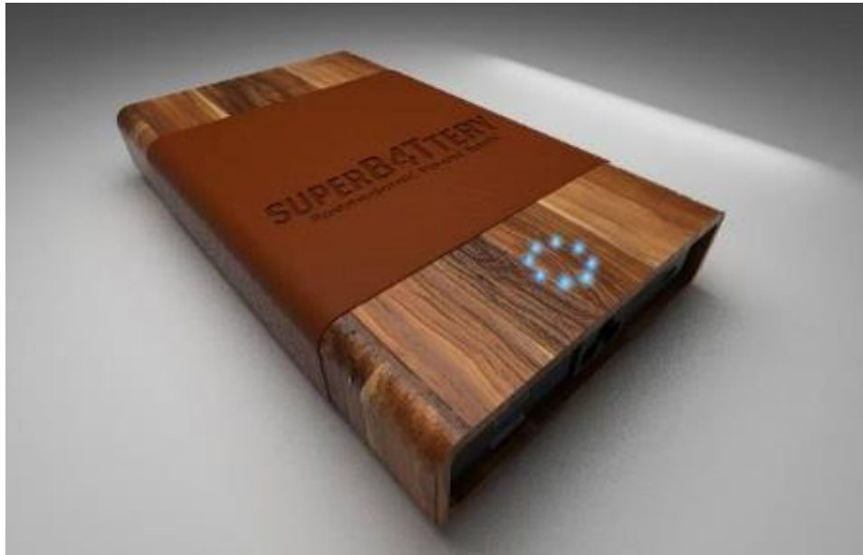
Gambar II.13 SuperBATtery Powerbank Product Design Project (Sumber: Kultura Studio)