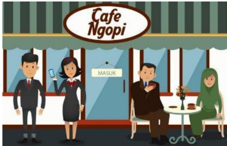
Gambar II.11 All About OJK – 2D Animation Project.