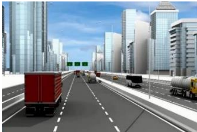
Gambar II.10 3D Animation for Presentation of Industrial Region Development.