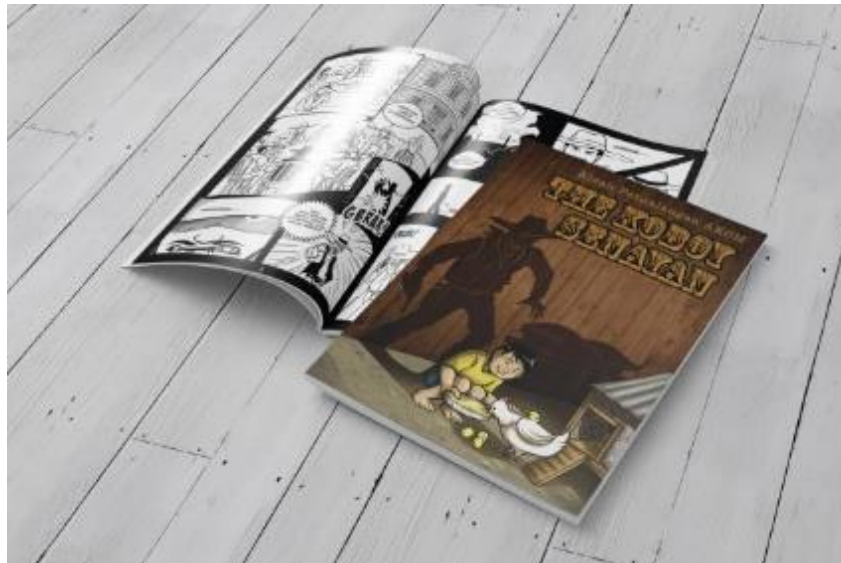
Gambar II.8 Akom The Koboy Senayan Biographical Comic Project

Gambar berikut adalah Portofolio kedua merupakan komik hasil karya PT.Kultura