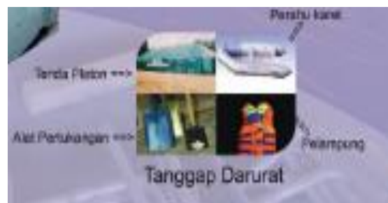
Gambar 2.10 Tanggap Darurat