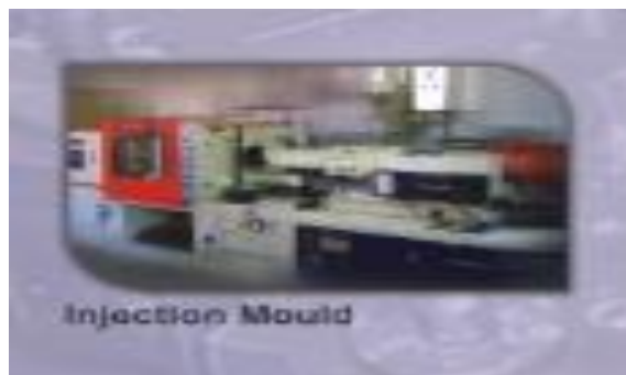
Gambar 2.4 Injection Mould