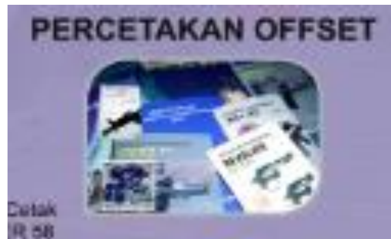
Gambar 2.9 Percetakan Offset