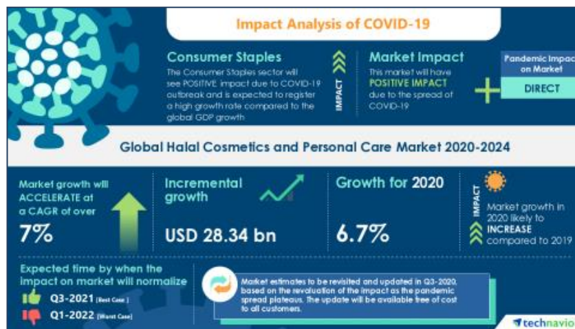
Gambar 1.4 Halal Cosmetics And Personal Care Market Analysis Highlights the Impact of COVID-19 (2020-2024) | Growing Interest In Personal Grooming to boost the Market Growth