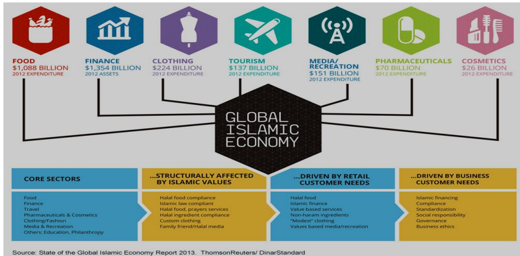
Gambar 1.3 Global Islamic Economy