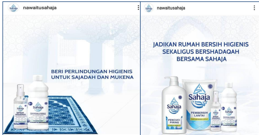
Gambar 1.5 Iklan Produk Sahaja pada Sosial Media Instagram