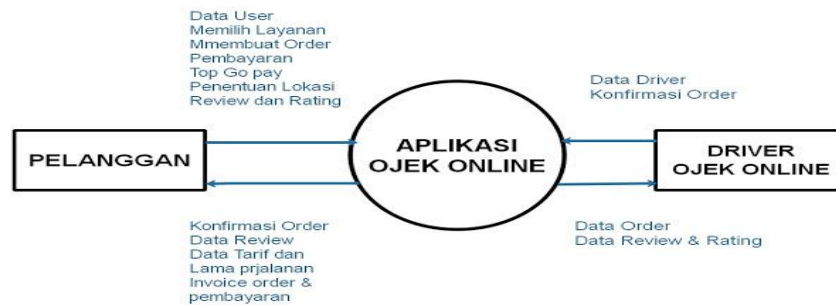
Tabel 2.2 Gambar DFD ( https://anaktik.com/cara-membuat-dfd-level-0-dan-contoh-dfd-lvel-0/ )

dalam berbagai tujuan analisa sistem, termasuk menggambarkan suatu aliran data logis melewati suatu proses.[24] Selain itu DFD dapat memberikan sesuatu yang lebih konseptual, gambaran non-fisik atas pergerakan data melewati suatu sistem. Penggunaan DFD Sebagai Modeling Tool dipopulerkan Oleh Demarco & Yourdon (1979) dan Gane & Sarson (1979) dengan menggunakan pendekatan Metoda Analisis Sistem Terstruktur[25].