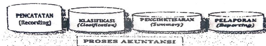
Gambar 2.2 Proses Akuntansi [36]

Menurut Supriyati dalam bukunya yang berjudul Akuntansi Keuangan Dasar menjelaskan bahwa: “proses akuntansi adalah tahapan-tahapan di dalam siklus akuntansi mulai dari pencatatan, klasifikasi, pengikhtisaran sampai dengan pelaporan”[36].