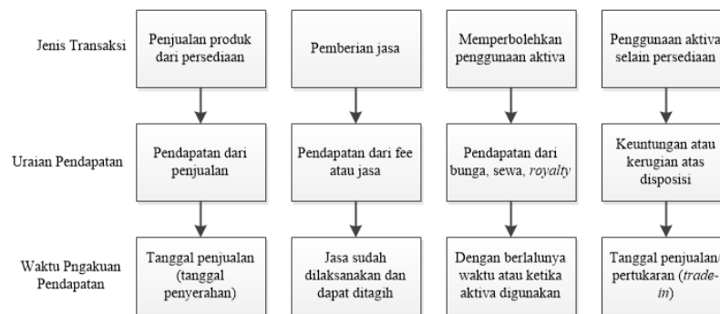
Gambar 2.1 Pengakuan Pendapatan diklasifikasikan menurut sifat transaksi

“Pengakuan ( recognition ) adalah pencatatan item-item dalam ayat-ayat jurnal, dimana untuk setiap item diakui harus memenuhi salah satu dari definisi dari unsur laporan keuangan. Pengakuan adalah “proses mencatat atau memasukkan secara formal suatu pos dalam akun dan laporan keuangan entitas”. “Pengakuan ini meliputi penjelasan suatu pos baik dengan kata-kata maupun angka, dan jumlah itu termasuk dalam angka total laporan keuangan”. Transaksi pendapatan sering digambarkan dalam diagram sebagai berikut: