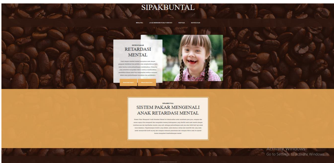
Gambar 2. Halaman Pengguna