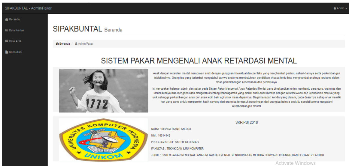
Gambar 3. Halaman Admin