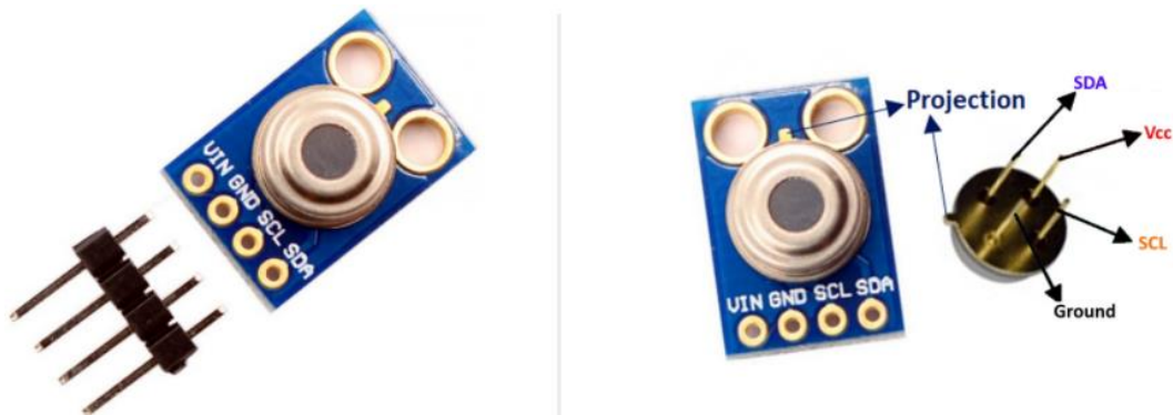
Gambar 2.2 MLX90614

MLX90614 adalah termometer Infra Merah untuk pengukuran suhu non kontak. Baik chip detektor termopile sensitif IR dan pengkondisian sinyal ASSP terintegrasi dalam kaleng TO-39 yang sama. Berkat penguat kebisingan yang rendah, ADC 17-bit, dan unit DSP yang kuat, akurasi dan resolusi termometer yang tinggi dapat dicapai. Termometer ini telah dikalibrasi oleh pabrik dengan keluaran PWM dan SMBus digital. Sebagai standar, PWM 10-bit dikonfigurasi untuk terus mentransmisikan suhu terukur dalam kisaran -20 hingga 120^{\circ}\text{C} , dengan resolusi keluaran 0,14^{\circ}\text{C} . Default POR adalah antarmuka SMBus