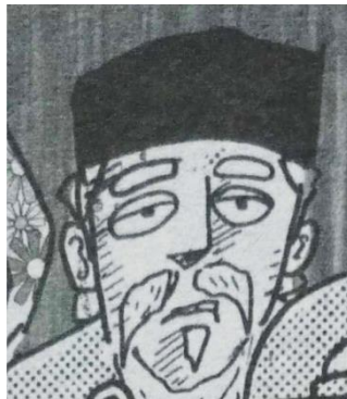
Gambar III.9 Tokoh Pendukung 7, Bapak Varokah

Tidak terlalu banyak dimunculkan pada komik ini. Tokoh Bapak Varokah memakai kopiah hitam, berkumis putih dan sedikit berjenggot. Bapak Varokah hanya dimunculkan pada akhir cerita saja bersama Mamah Varokah.