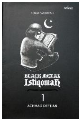
Gambar III.1 Sampul Komik Black Metal Istiqomah

Pada bagian Belakang terdapat tulisan “Tobat Varokah” dan juga “Black Metal Istiqomah”. Dibawah tulisan itu terdapat Sinopsis dari komik tersebut. Dibawahnya lagi terdapat logo dari Black Metal Istiqomah. Pada bagian belakang juga terdapat nama dari perusahaan penerbit yaitu Salam dan juga terdapat barcode disampingnya. Pada sisi sebelah kanan diisi logo dari Black Metal Istiqomah. Sedangkan bagian sisi kiri diisi dengan profil dari penulis dan pembuat komik. Kemudian pada hardcover buku, hanya terdapat logo dari Black Metal Istiqomah saja yang menghiasi bagian depan buku.