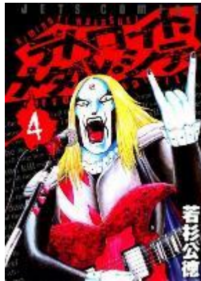
Gambar III.12 Referensi Karakter Varokah

Referensi tokoh Varokah diambil dari tokoh Johannes Krauser II yang ada pada anime yang berjudul “Detroit Metal City”. “Detroit Metal City” merupakan anime yang bermula dari sebuah komik. Mengisahkan tentang seorang laki-laki yang memiliki dua kepribadian. Saat bernyanyi di panggung, tokoh tersebut totalitas menjadi seorang vokalis band metal , namun di kehidupannya sehari-hari tokoh tersebut adalah laki-laki yang sedikit lugu dan menyukai lagu pop. Tokoh dalam anime “Detroit Metal City” ini memiliki rambut yang panjang serta lurus, pakaian serba hitam dan juga riasan wajah yang terlihat seram menjadi ciri khas tokoh tersebut. Begitupula dengan tokoh Varokah yang secara visual berambut panjang, pakaian serba hitam dan terlihat seram pada wajahnya.