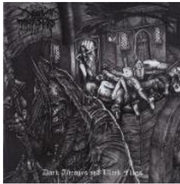
Gambar III.15 Sampul Album Dark Thrones

Ilustrasi tentunya hal yang penting dalam sebuah komik. Ilustrasi yang terdapat pada komik ini bernuansa hitam putih. Menurut Deptian (2018) berdasarkan wawancara menyatakan bahwa referensi visual dari komik yang dibuat hitam putih berdasarkan pada sampul album sebuah grup band black metal yang bernama Dark Thrones. Warnanya seperti hasil fotokopi menjadi referensi komik Black Metal Istiqomah yang juga berwarna hitam putih.