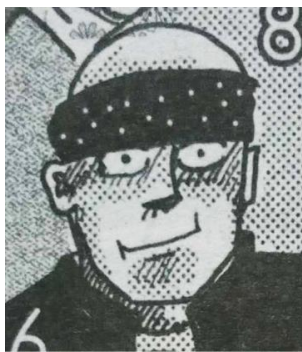
Gambar III.7 Tokoh Pendukung 5, Boggi

Boggi Smile merupakan tokoh yang agak gemuk, berkepala botak dan memakai head band . Sahabat Varokah dan juga Punky sejak kecil ini adalah seorang rapper . Selalu kalah dari Opik saat sedang adu kemampuan nge-rap . Boggi digambarkan selalu memakai baju lengan pendek dan dilapisi rompi.