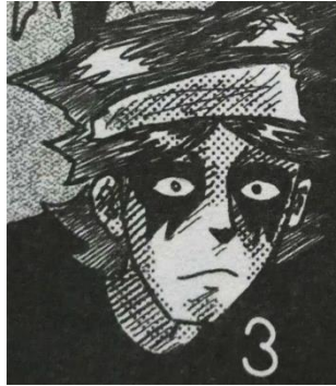
Gambar III.4 Tokoh Pendukung 2, Vyrman

Seorang teman Varokah sejak kecil dan juga pernah satu band dengan Varokah. Orang yang mendukung keputusan Varokah dalam berhijrah. Semenjak mengetahui Varokah hijrah, Vyrman juga ikut Varokah hijrah dengan mulai melaksanakan sholat.