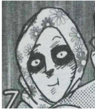
Gambar III.8 Tokoh Pendukung 6, Mamah Varokah

Mamah Varokah tidak banyak dimunculkan pada komik ini. Hanya ada pada akhir cerita. Mamah Varokah digambarkan secara visual dengan memakai kerudung motif bunga-bunga dan wajah yang juga seperti riasan corpse paint . Mamah Varokah adalah sosok Ibu yang cerewet.