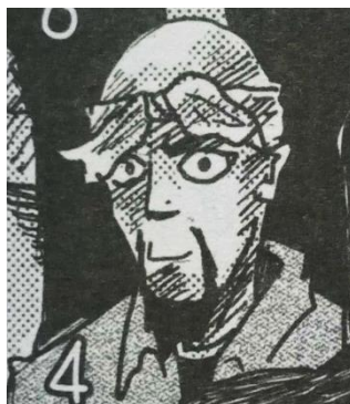
Gambar III.5 Tokoh Pendukung 3, Topik

Topik Syukur merupakan seorang rapper yang juga merupakan teman Varokah. Secara visual, topik digambarkan dengan kain bandana yang terikat pada kepala dan juga jenggot yang lumayan panjang dan kepala yang botak. Topik orang yang rajin beribadah. Pada salah satu panelnya menceritakan saat Topik melaksanakan sholat Dhuha.