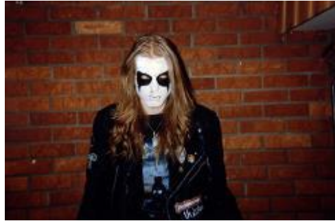
Gambar III.13 Referensi Corpse Paint

memiliki bentuk yang membulat namun tidak bulat sempurna menyerupai topeng pada mata. Lalu pada bagian bawah diberi sudut lancip yang memanjang hingga ke pipi. Desain ini kemudian menjadi referensi dari desain corpse paint pada tokoh Varokah.