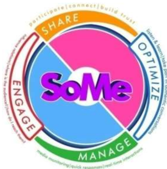
Gambar 2. 1 The Circular Model of SoMe

Terdapat empat aspek dalam model ini, keempat aspek tersebut memiliki kekuatan dalam bagiannya masing-masing, tetapi bersama-sama aspek ini memungkinkan praktisi untuk mengembangkan strategi yang solid. Model ini dibuat melingkar karena media sosial adalah percakapan yang terus berkembang, ketika sebuah perusahaan berbagi (Sharing) sesuatu mereka juga dapat mengelola (manage) atau terlibat (engage) dan bahkan mengoptimalkan (optimize) pesan mereka secara bersamaan. Berikut adalah penjelasan mengenai The Circular Model of Some menurut Regina Luttrell dalam bukunya social media :