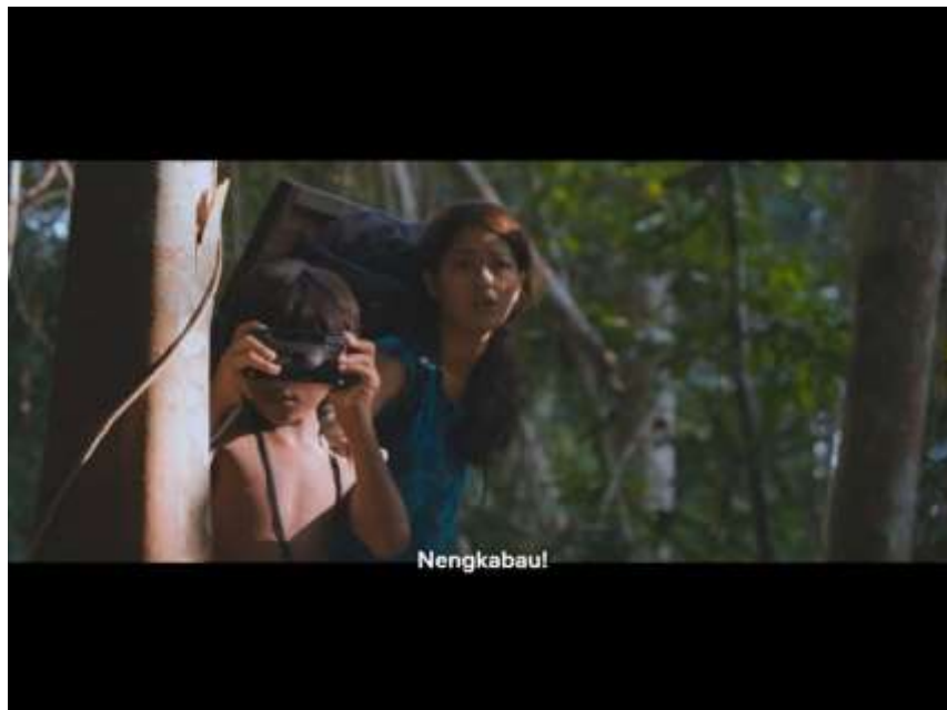
Gambar 1. 2 Kelompok belajar Butet sedang mengambil foto penebang liar