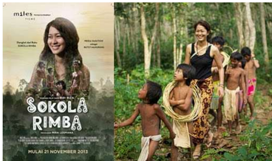
Gambar 1. 1 Sampul Film Sokola Rimba