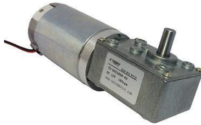
Gambar 2. 2. Motor dc