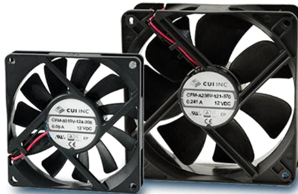
Gambar 2. 8. Kipas dc

Pada umumnya kipas ini digunakan untuk mendinginkan suatu benda yang benda tersebut memiliki panas yang terlalu berlebihan, kipas angin juga ditemukan di mesin penyedot debu dan berbagai ornamen untuk dekorasi ruangan. Tapi pada alat ini kipas dc berfungsi untuk menyemburkan panas yang dihasilkan oleh heater. Dan heater tersebut akan memanaskan gabah yang berada di bawahnya.