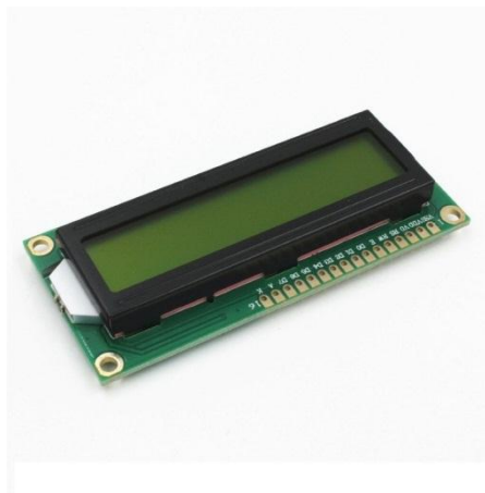
Gambar 2. 6. LCD16x2

LCD ( Liquid Crystal Display ) 16 X 2 adalah sebuah monitor mini yang sering digunakan untuk menampilkan sebuah data yang di ambil dari sebuah sensor. LCD yang digunakan adalah jenis LCD yang menampilkan data dengan 2 baris tampilan pada display. Disini lcd digunakan untuk mengetahui ukuran dari sensor suhu dht yang di control oleh arduino nano.[2]