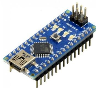
Gambar 2. 1. Arduino nano

ArduinoNano adalah sebuah papan kendali yang berukuran kecil yang digunakan untuk mengendalikan alat-alat elektronika. Ic yang digunakan pada papan kendali ini biasanya menggunakan atmega328 atau atmega168. [7]