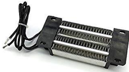
Gambar 2. 3. Heater incubator.