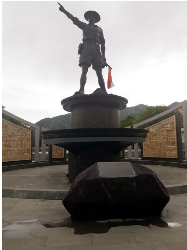
Gambar 1.1 Patung Nani Wartabone

Dari uraian diatas maka penulis bermaksud mengangkat judul penelitian yaitu “kajian patung monumen perjuangan Nani Wartabone lealui latar belakang dan visualisasinya” .