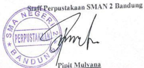
Pipit Mulyana NIP.10000002