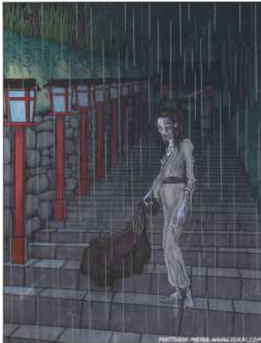
Gambar III.3.1 Ilustrasi dari makhluk halus Jepang Ame Onna

Bentuk Visual yang digunakan akan disesuaikan dengan khalayak sasaran, dengan menyederhanakan visual dari makhluk-makhluk halus Jepang yang pernah dibuat. Ilustrasi yang ada adalah sebagai penunjang dari informasi-informasi yang ada didalam buku.