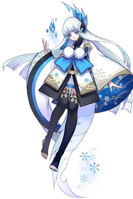
Gambar III.3.2 Yuki Onna dalam permainan ponsel Onmyouji