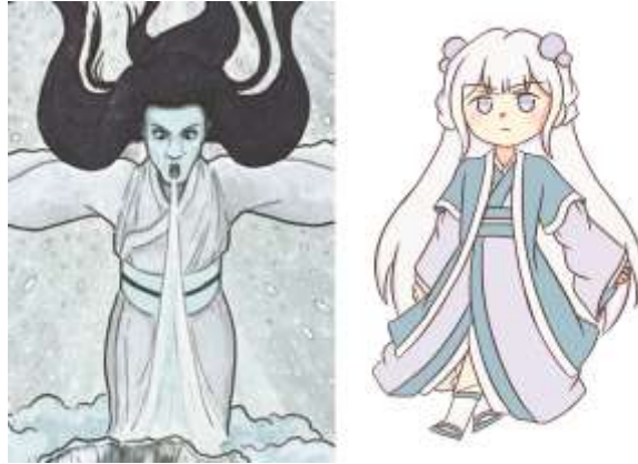
Gambar III.3.4.1.1 Karakteristik dari Yuki Onna