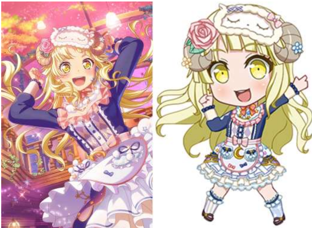
Gambar III. 2.2.1.1 Perbedaan Gaya Gambar Manga biasa dan Chibi dari Karakter Tsurumaki Kokoro dari Permainan Ponsel Bang Dream!

Pendekatan visual yang digunakan dalam perancangan ini berupa buku informasi bergambar dan berwarna untuk memberikan hiburan tersendiri pada khalayak sasaran yang membaca. Gaya gambar chibi dipilih, karena gaya gambar tersebut bersifat menyederhanakan visual aslinya, tidak terlalu mendetail penggambarannya, dan nyaman untuk penglihatan. Gaya gambar chibi juga cukup digemari dikalangan remaja awal sampai dewasa awal karena visual-nya yang lucu.