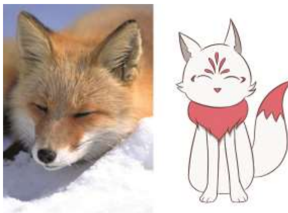
Gambar III.3.4.1.2 Karakteristik dari Kitsune

Salah satu karakter yang berwujud hewan adalah Kitsune, yang digambar seekor rubah, yang dimana merupakan arti dari Kitsune yang sebenarnya dalam Bahasa Jepang. Mimik wajah tersenyum dipilih, karena wajah rubah Jepang memang terlihat seperti sedang tersenyum. Ciri khas yang diambil adalah penggunaan warna merah dan putih, karena warna merah dan putih identik dengan warna pakaian yang dipakai oleh gadis penjaga kuil di Jepang ( Miko ), karena Kitsune merupakan utusan suci dari Dewa Inari dan patung Kitsune sering ditemui di kuil-kuil di Jepang, terutama di Kuil Fushimi Inari di Prefektur Kanagawa.