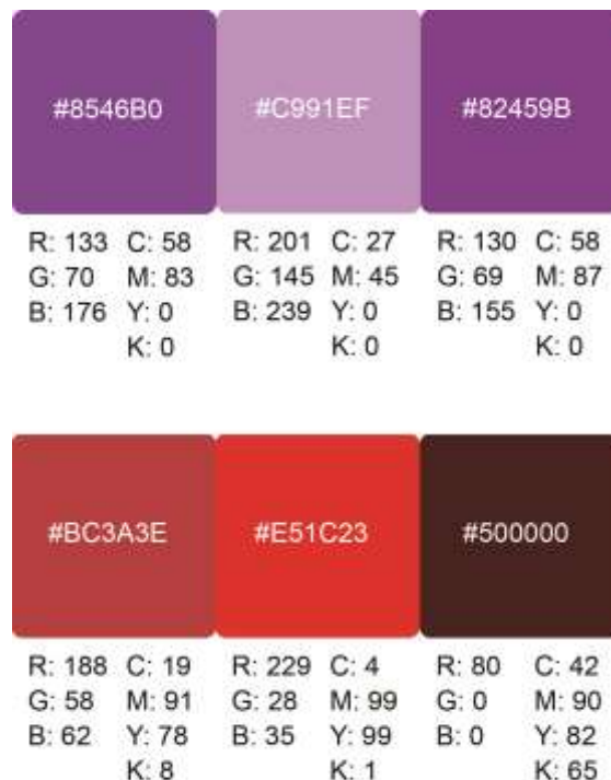
Gambar III.3.5.1 Konsep Warna Untuk Buku

Sedangkan warna untuk visualisasi karakter menggunakan warna dingin dan hangat, tergantung pada karakter yang divisualisasikan. Jika karakter dideskripsikan jahat, berhubungan dengan dewa, maka akan digunakan warna merah dan warna hangat lainnya. Jika karakter dideskripsikan memiliki sifat yang dingin, atau ranah hidupnya di tempat yang gelap, maka akan digunakan warna dingin atau warna gelap.