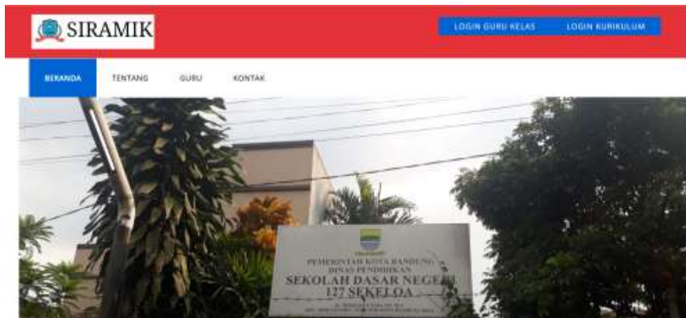
Gambar 3. Halaman Utama