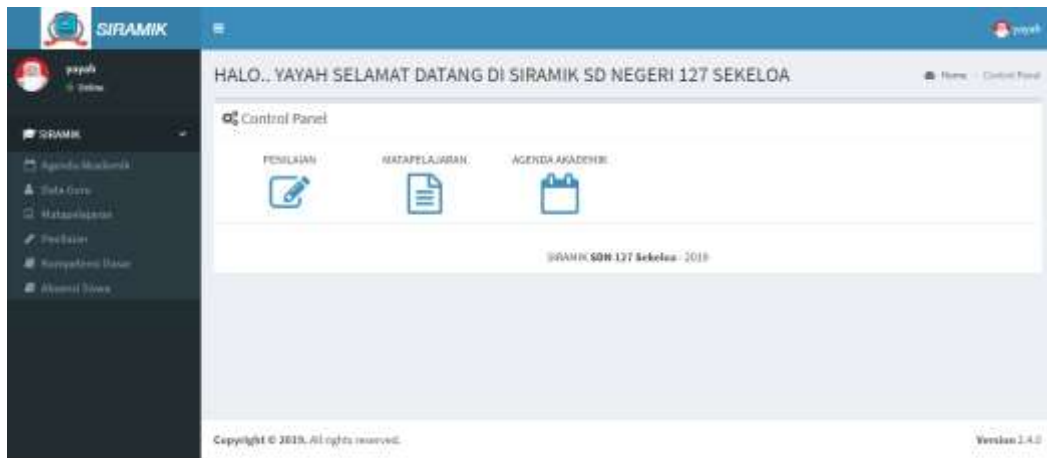
Gambar 7. Dashboard Guru kelas