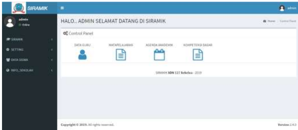
Gambar 5. Dashboard Admin (Bagian Kurikulum)