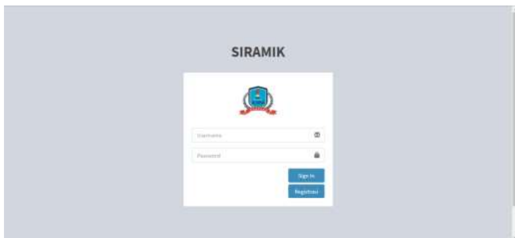
Gambar 6. Registrasi dan Login Guru Kelas