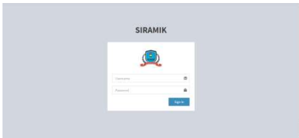
Gambar 4. Login Kurikulum (Admin)