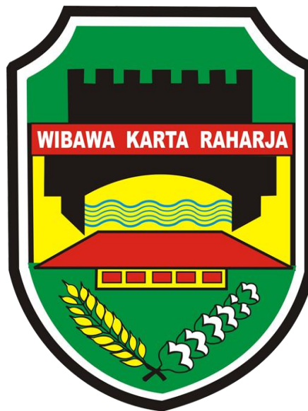
Logo Pemkab Purwakarta