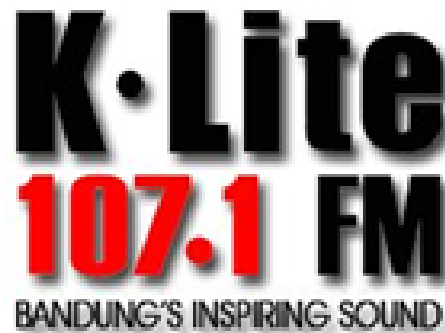
Gambar 1.1 Logo K-Lite Radio