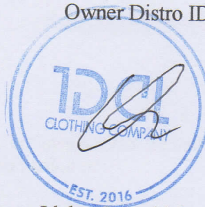
Idzhar Inzaghi Setiawan