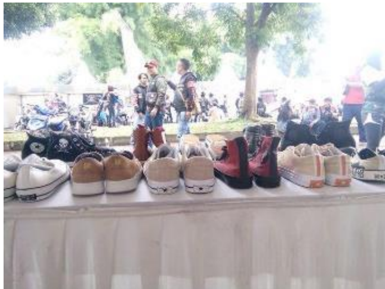
Gambar II.12 Booth komunitas di acara Bandung Lautan Bikers