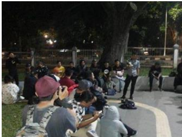
Gambar II.10 Meet up Converse Head Indonesia Bandung