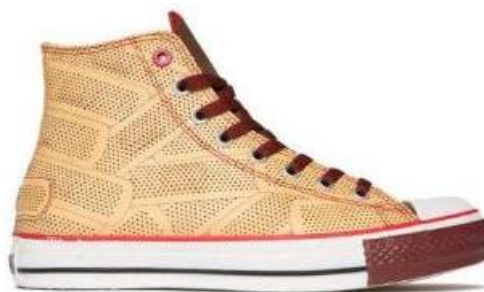
Gambar II.8 Converse edisi 1Hund(RED) Sumber: https://cdn.trendhunterstatic.com/thumbs/trendy-and-responsible-footwear-converse-red-product-new-launch.jpeg Diiakses: (03/ 12/ 2018)

Dengan bergesernya Converse akhirnya perusahaan tersebut berada di ambang kebangkrutan. Pada tahun 2003, perusahaan Nike membeli perusahaan Converse. Converse pun kembali diproduksi dan memproduksi beragam model sepatu, seperti Converse The Weapon, Converse special edition yang dibuat untuk The Ramones dan Sailor Jerry, dan tiga desain baru high top yang terinspirasi dari group band The Who. Selain itu, Converse pun memproduksi sepatu edisi khusus seperti 1Hund(RED), sepatu tersebut dipasarkan dan sebanyak 15% dari keuntungan digunakan untuk mendukung penanggulangan HIV / AIDS. Hingga saat ini tercatat lebih dari 100 orang seniman dari seluruh dunia membuat bermacam kreasi terhadap sepatu Converse.