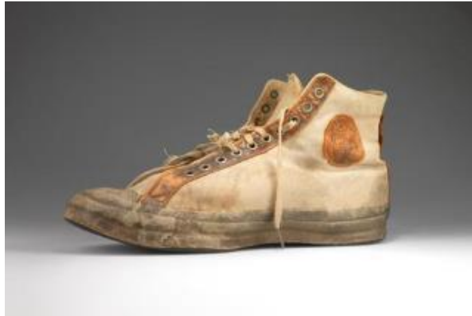
Gambar II.4 Converse All Star tahun 1917