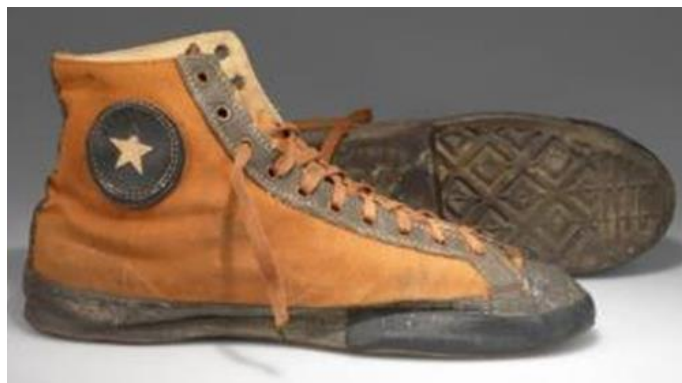
Gambar II.5 Converse dengan patch bintang

Pada tahun 1921 Charles H. "Chuck" Taylor terpikat pada sepatu All star milik Converse. Dia merupakan seorang pemain basket bernama di Amerika. Kemudian Converse menggajak Chuck Taylor untuk bergabung menjadi duta perusahaan tersebut dan mempromosikan sepatu Converse ke seluruh pelosok Amerika Serikat. Chuck Taylor menyarankan menambahkan patch bintang pada pergelangan kaki di sepatu tersebut. Setelah Chuck Taylor meninggal pada tahun 1969, Converse menambahkan nama dan tanda tangan Chuck Taylor pada patch sebagai bentuk apresiasi kepada Chuck Taylor karena dedikasi selama hidupnya kepada perusahaan tersebut.