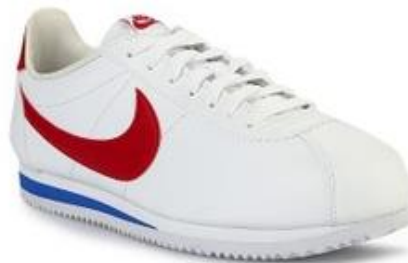
Gambar II.3 Cheap & Cheerful Shoes ( Sneakers ) Sumber: https://www.zalora.co.id/nike-mens-nike-classic-cortez-leather-shoes-white-1661849.html?position=20 Diakses: (03/ 12 / 2018)

Sepatu jenis ini termasuk dalam kategori harga yang terjangkau, seperti sneakers . Sepatu jenis ini dipakai oleh berbagai kalangan. Tidak hanya itu, sepatu jenis ini dapat digunakan kemana saja dan kapan saja tanpa ada batasan untuk acara yang khusus ataupun formal (Titoley Yubilate, 2017, h.73)