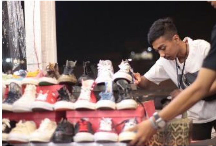
Gambar II.13 booth komunitas di acara Bandung Sneakers Season