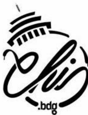
Gambar II.9 Logo Converse Head Indonesia regional Bandung