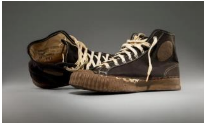
Gambar II.6 Ssepatu Converse untuk pelatihan tentara AS

Saat perang dunia II ditahun 1941, pemerintah Amerika Serikat mengontrak perusahaan Converse untuk membuat sepatu khusus untuk rekrutan tentara Amerika Serikat serta membuat sepatu untuk angkatan udara Amerika Serikat. Sekitar tahun 1950 sampai tahun 1960 Converse menjadi sepatu andalan anak sekolah dan para atlet karena membuat buku tahunan untuk mempromosikan citra Amerika di dunia.