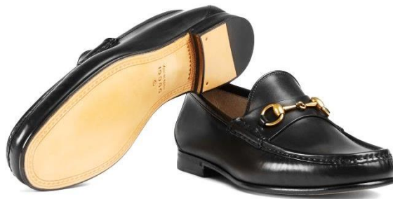
Gambar II.1 Pretty Shoes (Gucci Men's Moccasins & Loafers )

Sepatu ini berbahan kulit dan biasanya harga yang ditawarkannya pun sangat mahal, seperti sepatu loafer dari Gucci. Sepatu jenis ini hanya memiliki fungsi untuk memperindah penampilan saja, karena pretty Shoes hanya dipakai diacara-acara khusus saja yang bersifat formal.