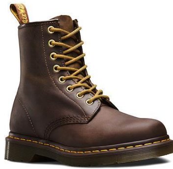
Gambar II.2 Everyday Shoes (Dr.Martens 1460 Crazy Horse) Sumber: https://www.drmartens.com/us/en/p/11822200 Diakses: (03/ 12 / 2018)