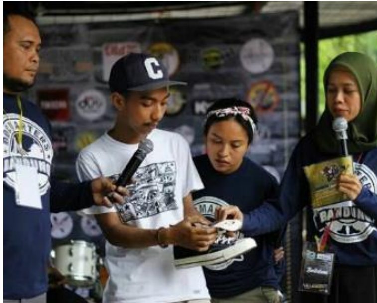
Gambar II.11 Sharing session Converse di acara Docmaters day