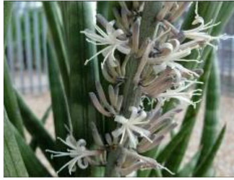
Gambar II.10 Bunga Lidah Mertua

Sumber: https://encrypted-tbn0.gstatic.com/images?q=tbn:ANd9GcSoZHStzb1IQm9uBtxE6H8qwrKhimcUAtp5XZGx1Y7M2YnFvXqIDA (31 oktober 2018)