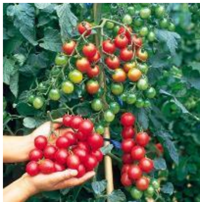
Gambar II.3 Tomat Ceri

Tanaman hias buah mempunyai keunggulan tersendiri dari tanaman hias lainnya, selain keindahan bentuk dan warna buahnya untuk menjadi hiasan yang mempercantik ruangan, juga buahnya bisa dikonsumsi. Tanaman hias yang termasuk pada tanaman hias buah ialah; Anggur, Jeruk Kalamansi, Tomat Ceri, dan lain-lain (para. 7).