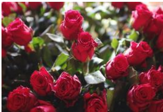
Gambar II.1 Bunga Mawar

Tanaman hias bunga mempunyai keindahan yang terletak pada bagian bunganya. Keanekaragaman bunga dan warnanya membuat tanaman hias bunga cocok untuk menjadi penghias ruangan baik diluar maupun didalam ruangan. Tanaman yang tergolong tanaman hias bunga ialah; Bunga Mawar, Bunga Melati, Bunga Anggrek, dan lain-lain (para. 3).