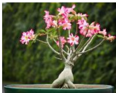
Gambar II.5 Kamboja

Keindahan dari tanaman hias jenis akar terletak pada akarnya baik itu alami maupun buatan. Tanaman yang termasuk tanaman hias akar ialah; Beringin, Kamboja, dan lain-lain (para. 18).