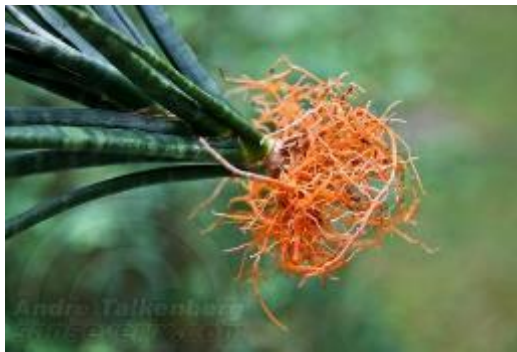
Gambar II.7 Akar Lidah Mertua

Tanaman Lidah Mertua merupakan jenis tumbuhan berbiji tunggal (monokotil). Akar monokotil dicirikan mempunyai akar berbentuk serabut. Akar dengan warna putih merupakan akar yang sehat sedangkan akar berwarna cokelat merupakan akar yang sakit (Krisnakai, 2017:para. 3).