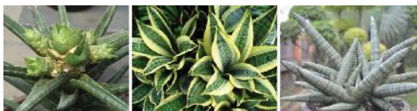
Gambar II.9 Daun Lidah Mertua Sumber: Dokumen Pribadi (31 ktober 2018)

Tanaman Lidah Mertua mudah dikenali dari bentuk daunnya yang tebal karena mengandung banyak air sehingga membuat Lidah Mertua tahan terhadap kekurangan air. Daun Lidah Mertua tumbuh di sekeliling batang semu di atas permukaan tanah. Daun pada tanaman Lidah Mertua terdiri dari 2-6 helai daun per tanaman, mempunyai panjang 15 – 150 cm, dan lebar 4 – 9 cm, bertekstur licin, umumnya mempunyai warna hijau diikuti motif berwarna kuning atau putih (Krisnakai, 2017: para. 5).