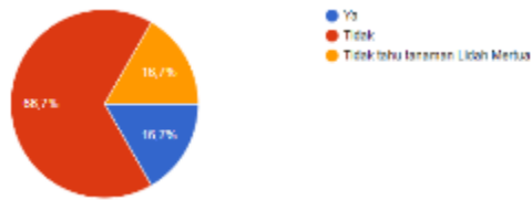
Gambar II.15 Diagram Kuesioner 3

Berdasarkan gambar diatas, sebanyak 66,7% responden tidak mengetahui manfaat tanaman Lidah Mertua dan 16,7% bahkan tidak mengetahui Lidah Mertua. Jadi, total yang tidak mengetahui manfaat Lidah Mertua ialah 83,4% responden.