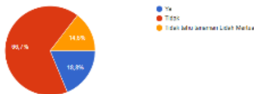
Gambar II.16 Diagram Kuesioner 4

Berdasarkan gambar diatas, responden sebanyak 66,7% menyatakan tidak mempunyai tanaman Lidah Mertua di rumah dan 14,6% mengaku tidak mengenal Lidah Mertua, jumlah total responden yang tidak mempunyai Lidah Mertua dirumahnya berjumlah 81,3%.