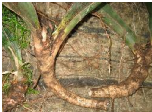
Gambar II.8 Rimpang Lidah Mertua