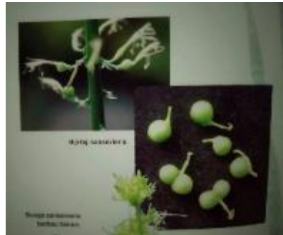
Gambar II.11 Biji Lidah Mertua

Biji pada tumbuhan dihasilkan dari pembuahan serbuk sari pada kepala putik. Biji mempunyai peran penting dalam perkembangbiakan tanaman. Lidah Mertua mempunyai biji berkeping tunggal (monokotil). Pada bagian paling luar biji terdapat kulit tebal yang mempunyai fungsi sebagai lapisan pelindung, sedangkan pada bagian dalam kulit terdapat embrio yang merupakan benih tanaman (Krisnakai, 2017: para. 7).