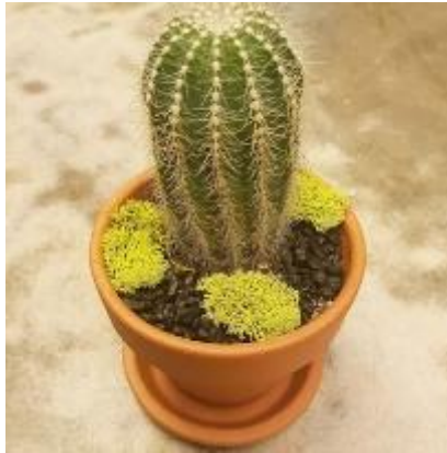
Gambar II.4 Kaktus Mini

Tanaman hias batang mempunyai keindahan yang terletak pada bagian batang sebagai ciri khasnya. Bentuknya yang unik, membuat beberapa diantaranya dikembangkan dalam bentuk bonsai agar mempunyai nilai keindahan yang lebih tinggi. Tanaman hias yang termasuk tanaman hias batang ialah; Bambu Kuning Mini, Kaktus Mini, dan lain-lain (para. 15).