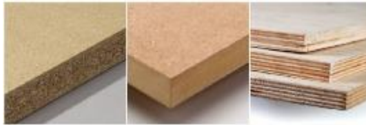
Gambar II.12 Papan Partikel, MDF, dan Multiplek

bermotor. Di rumah, sumber Formaldehid yang paling memungkinkan adalah material bangunan yang terbuat dari papan partikel, medium density board (MDF), maupun multiplek ( plywood ) yang mengandung resin Formaldehid. Sumber Formaldehid lainnya termasuk penggunaan kompor gas, kompor kayu bakar, atau kompor minyak di ruangan tanpa ventilasi, dan juga asap rokok (para. 5).