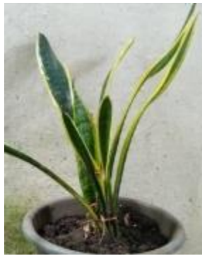
Gambar II.6 Tanaman Lidah Mertua Sumber: Data Pribadi (19 Desember 2017)

Di Indonesia, pada umumnya tanaman Sansevieria dikenal dengan sebutan Lidah Mertua. Tanaman Lidah Mertua mempunyai habitat asli pada daerah tropis yang mempunyai cuaca panas. Keindahan daun dari Lidah Mertua ini sangat mempesona. Ada bermacam variasi daun pada Lidah Mertua mulai dari bentuk, warna, motif dan ukurannya yang membuat tanaman tersebut digemari masyarakat.