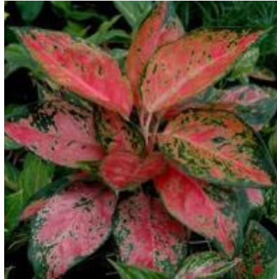
Gambar II.2 Aglaonema