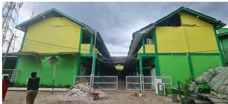
Gambar I.1 SD Setelah Gempa

SMK. Selain itu, terdapat juga asrama dan panti asuhan. Dengan adanya fasilitas ini, Islamic Centre tidak hanya berfungsi sebagai tempat ibadah, tetapi juga sebagai pusat pendidikan dan tempat perlindungan bagi yang membutuhkan dibandingkan dengan sekolah lain. menerapkan kebiasaan membaca Al-Quran selama 30 menit sebelum memulai jam pelajaran, menciptakan lingkungan yang mendalami nilai-nilai keagamaan sejak dini. Selain itu, setiap hari, siswa juga meluangkan waktu selama 1 jam untuk mengikuti tausiyah di Masjid Al-Mujahidin. Hal ini mencerminkan komitmen untuk mempromosikan pendidikan agama dan nilai-nilai keagamaan dalam proses pendidikan, yang menjadikan Islamic Centre ini agak berbeda dan berfokus pada pengembangan keagamaan siswa. Selain fasilitas pendidikan, Islamic Centre Aisyiyah Muhammadiyah Cianjur juga memberikan pelayanan sosial melalui panti asuhan yatim Aisyiyah. Kompleks ini juga memiliki masjid Muhammadiyah terbesar di Cianjur yang bernama Al-Mujahidin, yang menjadi tempat ibadah dan pusat kegiatan keagamaan. Sejak berdirinya pada tahun 1989, kompleks ini telah memainkan peran penting dalam menyediakan fasilitas pendidikan dan pelayanan sosial bagi masyarakat di wilayah Cianjur.