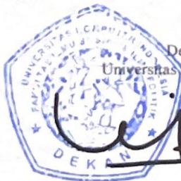
Dekan FISIP Universitas Komputer Indonesia