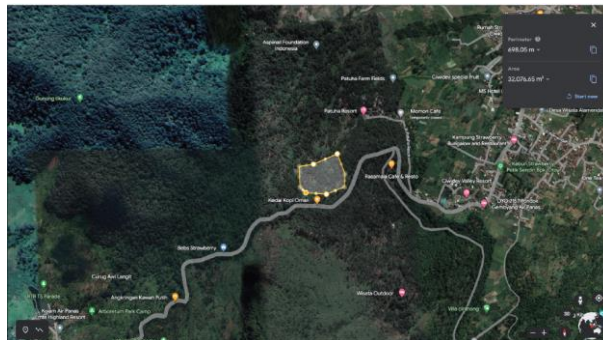
Gambar 2.1 Peta Lokasi Site (Google Earth, 2023)

Lokasi Perancangan Hotel Resort terletak di Kecamatan Ciwidey, kabupaten bandung. Lokasi site yang dipilih ditunjukkan pada gambar 2.1, berdasarkan pertimbangan karakteristik lokasi untuk hotel resort yang tertera di buku “ Hotel and Resort, Planning, Design and Refurbishment ”