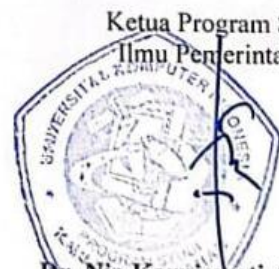
Ketua Program Studi Ilmu Pemerintahan