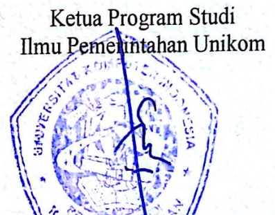
Ketua Program Studi Ilmu Pemerintahan Unikom