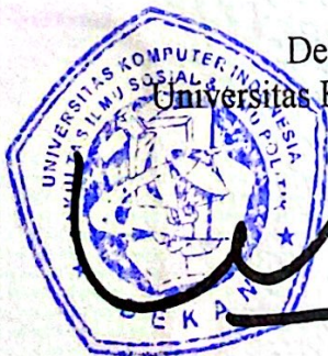
Dekan FISIP Universitas Komputer Indonesia