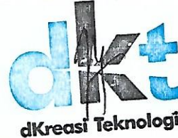
Theodorus Halsey Ikhsan