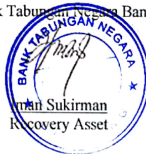
Sukirman Recovery Asset