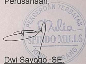
Dwi Sayogo, SE. NIP. 14110139 K