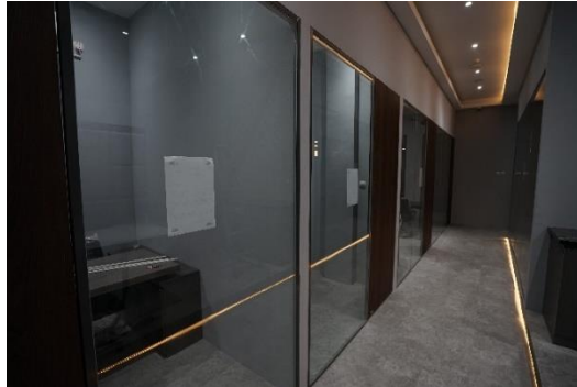
Gambar II. 7 Lantai 1 JKI Building