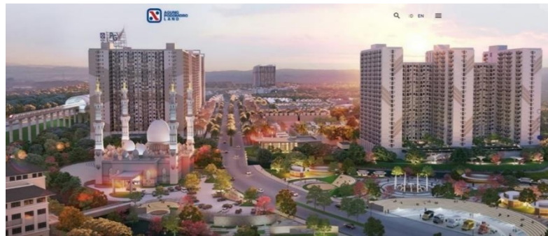
Gambar II. 9 Website APL

Dilansir dari website resmi PT. Agung Podomoro Land ialah pemilik, pengembang, serta pengelola real estate yang sudah tercatat pada bursa saham pada segmen real estate ritel , komersial dan perumahan dengan kepemilikan beragam. Memiliki model pengembangan properti yang terpadu, mulai dari pembebasan dan atau pengadaan lahan, sehingga desain dan pengembangan, hingga manajemen proyek, penjualan, penyewaan dan pemasaran secara komersil, hingga operasi dan