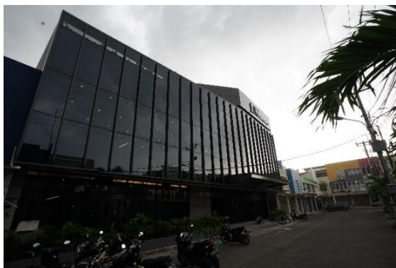
Gambar II. 6 Gedung JKI Building