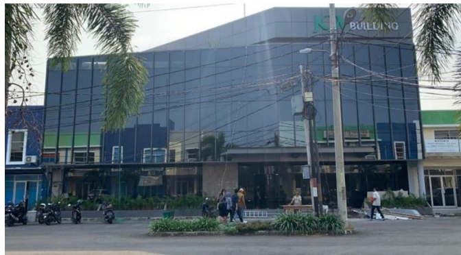
Gambar II. 1 Gedung PT. Jasa Kawan Indonesia