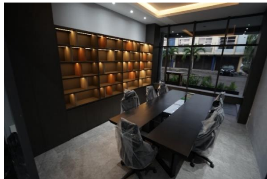
Gambar II. 8 Ruang Meeting Lantai 1

Lantai 1 ini ada beberapa ruangan yang terdiri dari ruangan HRD ruangan penasehat dan ruangan meeting 1 yang digunakan untuk keperluan meeting antar anak perusahaan.