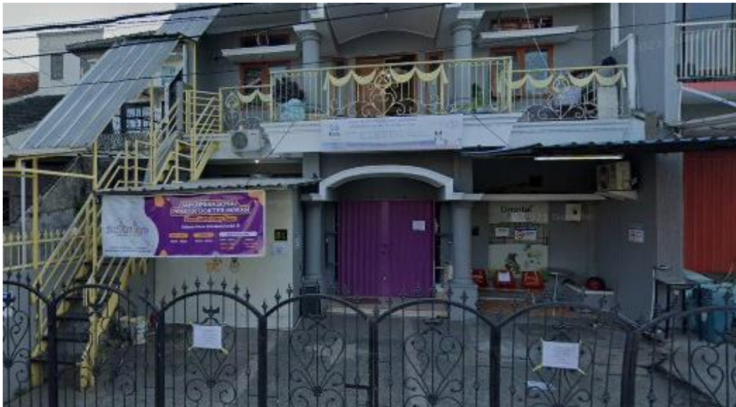
Gambar I.2 Halaman depan Zoom Veterinary Team Bandung Sumber: Dokumen Pribadi (2022)

Di Bandung jumlah populasi hewan tidaklah sedikit meskipun tidak adanya hitungan pasti di dalam dinas kota Bandung tetapi dapat dilihat di setiap jalan banyak hewan-hewan liar berkeliaran dan tidak diurus yang dapat menghasilkan penyakit-penyakit yang berbahaya baik untuk hewan lain maupun manusia itu sendiri. Klinik hewan di Bandung yang menjadi pusat kesehatan kebanyakan berbentuk klinik dan sangat kurang dalam fasilitas serta tingkat kenyamanan, padahal banyak sekali hewan yang membutuhkan cek kesehatan dan perawatan. dari banyaknya klinik hewan yang ada di Bandung salah satunya adalah Klinik Zoom Veterinary Team Bandung.