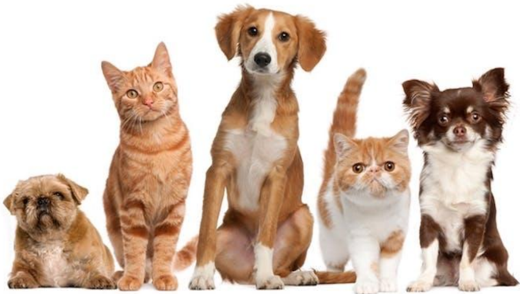
Gambar I.1 Hewan Peliharaan

Hewan adalah makhluk hidup yang ada di sekitar masyarakat, juga merupakan bagian dari hidup masyarakat. Manusia dan hewan itu saling berkaitan contohnya seperti orang memelihara hewan untuk dijadikan peliharaannya dari rasa menyukai hewan sampai hobi sebagai penghilang stres. Meskipun banyak masyarakat yang memelihara hewan tetapi dari segi pengetahuan tentang kesehatan hewan masyarakat masih belum begitu mengerti karena masih kurang kurangnya informasi tentang kesehatan hewan itu sendiri.