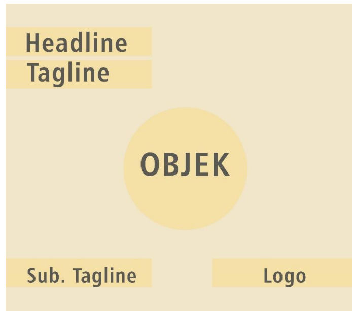
Gambar III.3 Tata Letak Media Utama Instagram Sumber: Dokumen Pribadi (3 Januari 2019)

Pada tata letak yang digunakan pada layout ini menggunakan format persegi 1 : 1 dengan menampilkan objek gambar ditengah poster dan menaruh headline dan tagline di pojok kiri atas, lalu untuk sub headline ditempatkan pada posisi pojok bawah kiri dan logo di tempatkan pada pojok bawah kanan. Dengan objek yang ditempatkan ditengah bertujuan untuk menarik perhatian masyarakat khususnya khalayak sasaran. Selain itu objek diperbesar dan dengan tata letak teks yang sedikit sehingga menimbulkan ketertarikan untuk melihat apa isi poster tersebut. Seperti pada umumnya kebiasaan membaca atau melihat di Indonesia yang membaca sesuatu dari posisi kiri atas dan perlahan kebawah untuk melihatnya.