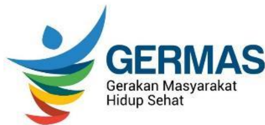
Gambar III.1 Gernas

Menggunakan dua mandatory tersebut, dikarenakan bahwa Gerakan Masyarakat Hidup Sehat menangani persoalan pola hidup yang sehat dan mengajak untuk masyarakatnya agar tetap menjaga kesehatan dari mulai pola hidup dan pola makan, sedangkan Dinas Kesehatan kota Bandung menangani soal berbagai masalah kesehatan di Bandung. Kedua mandatory tersebut akan berguna untuk membuat sebuah poster digital.