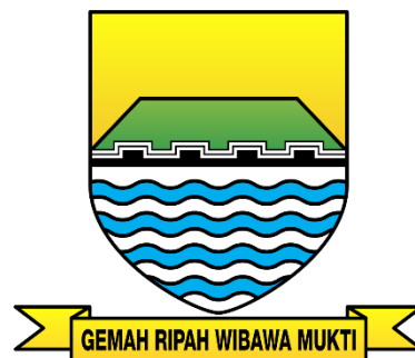
Gambar III.2 Dinas Kesehatan Kota Bandung

Sumber: http://sehatnegeriku.kemkes.go.id/wp-content/uploads/2016/11/logo-GERMAS-2.jpg (3 Januari 2019)