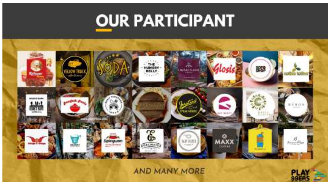
Gambar 1. 2 Stakeholders Eksternal Radio Play99ers 100FM Bandung