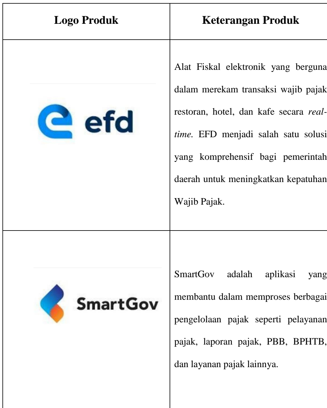
Tabel 2.1 Produk-Produk Cartenz Group