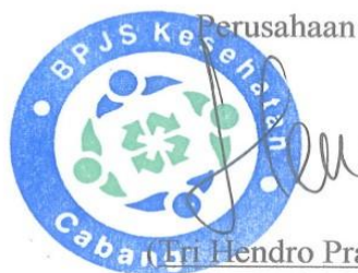
(Hendro Pradoto) NPP. 03089