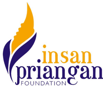
Gambar II.1 Logo Yayasan Insan Priangan

Yayasan memiliki sebuah logo, yang digunakan pada berbagai media perusahaan.