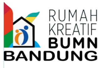
Gambar II.2 Logo Perusahaan RKB

Rumah Kreatif Bandung saat ini beralamat di Jl.Jurang No.50 Kel.Pasteur Kecamatan Sukajadi Kota Bandung, Jawa Barat, yang awalnya merupakan kantor dari Bank Rakyat Indonesia namun sekarang digunakan oleh Rumah Kreatif Bandung (RKB).