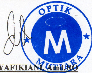
DIAN SYAFIKIAN, AMRO PEMIMPIN